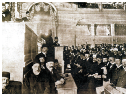
Osmanlı Mebusan Meclisi