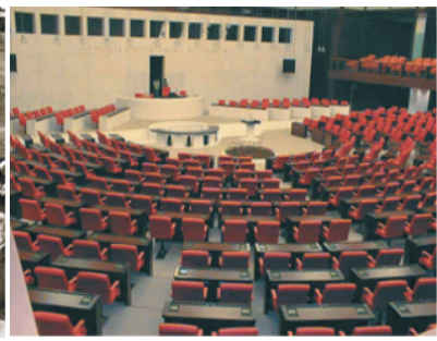
Türkiye Büyük Millet Meclisi

Yukarıdaki görseller değerlendirildiğinde tarihimizdeki devlet kurumları ile ilgili olarak;